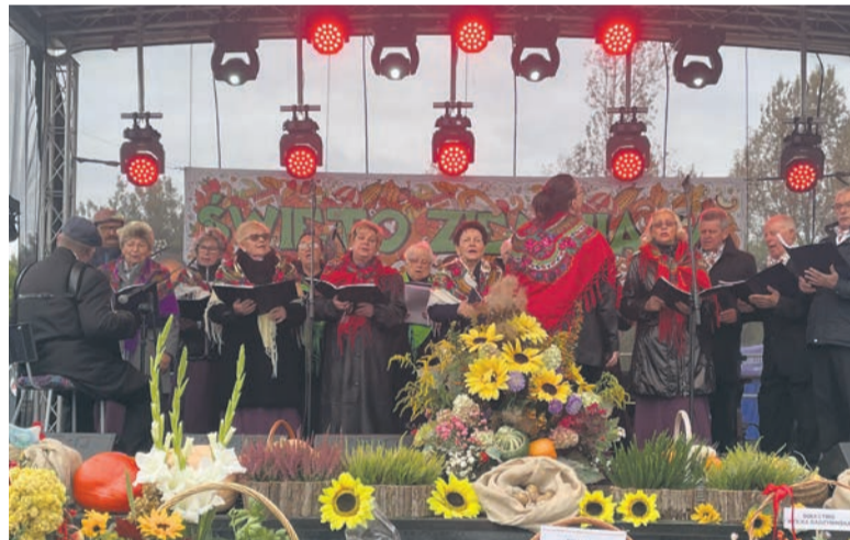
Chór Młodzież 50+