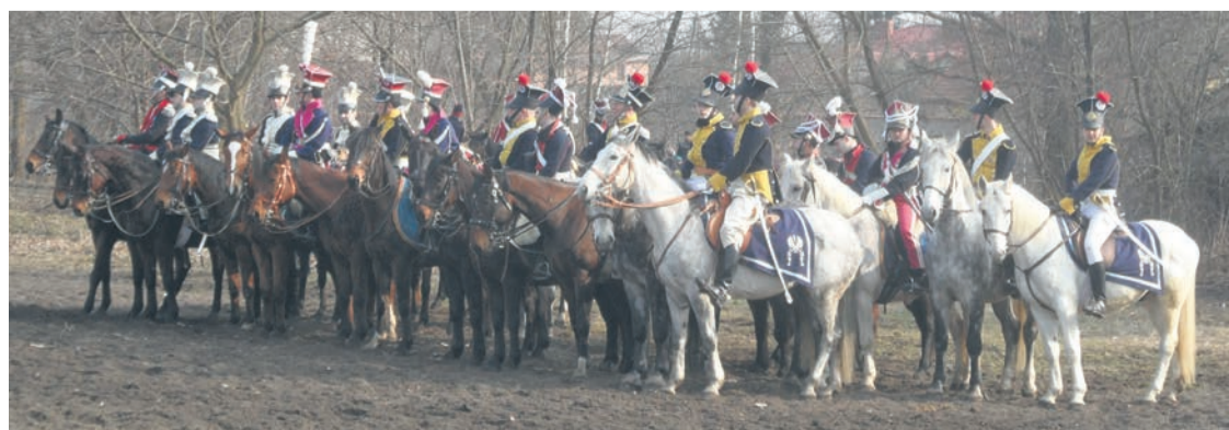
Jazda polska w Powstaniu Listopadowym - inscenizacja Olszynka Grochowska 2012 r.

□ Dariusz Wróbel Nieporęckie Stowarzyszenie Historyczne