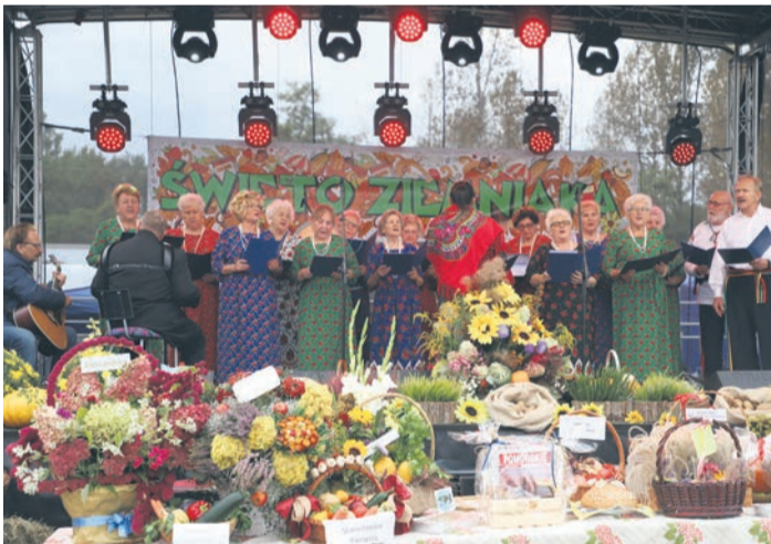
Chór Echo Nieporętu