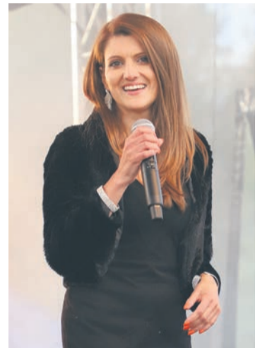
Zespół Blue MOON

Wójt Gminy Nieporęt, Szef WCR Warszawa - Śródmieście, Dyrektor Szkoły Podstawowej w Nieporęcie zapraszają na koncert