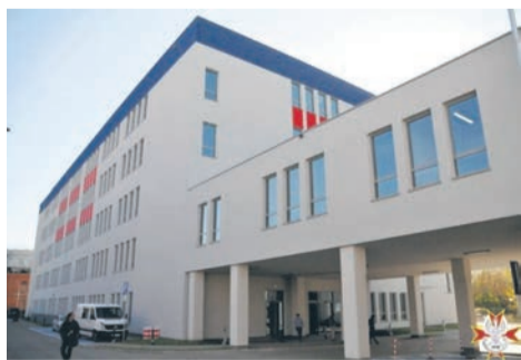
fol. Wojskowy Instytut Medyczny

NiŚOZ to świadczenia z zakresu pediatrycznej i internistycznej opieki zdrowotnej, udzielane od poniedziałku do piątku w godzinach od 18.00 do 8.00 dnia następnego oraz całonocowo w dni ustawowo wolne od pracy. Tego